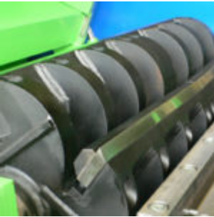
Młyn MeWa USM 1000