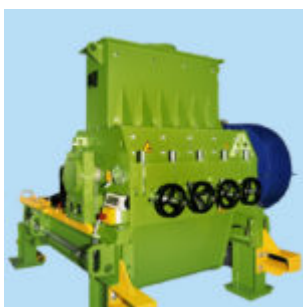
Młyn MeWa USM 1000