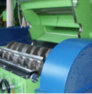
Młyn MeWa USM 1000