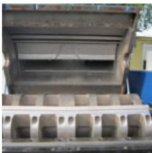
Młyn MeWa USM 1000